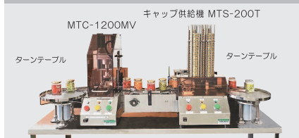
キャップ供給機 MTS-200T MTC-1200MV