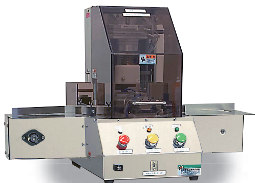
卓上真空キャッパー MTC-1200MV