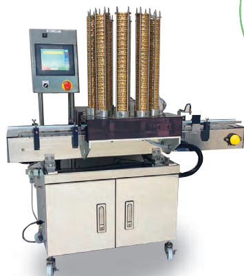
自立型キャップ供給機 MJS-500T