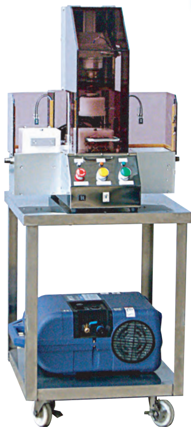
真空キャップ巻締機MTC-1000V